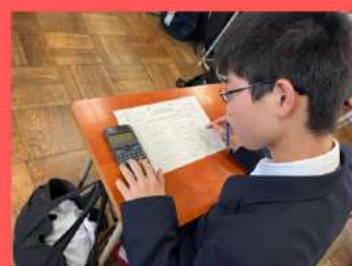
↑計算技術検定の演習中